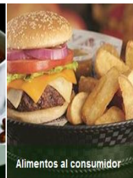
Alimentos al consumidor