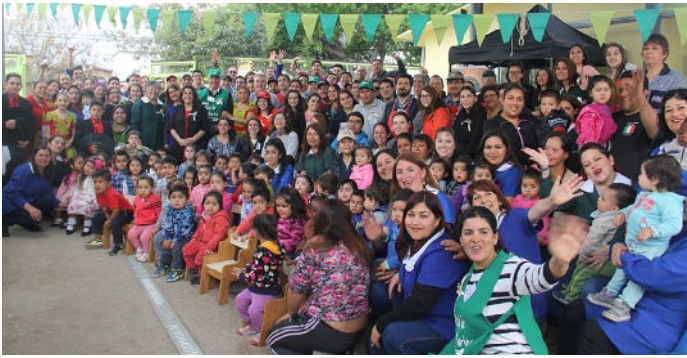
El pasado 27 de septiembre, voluntarios de TMLUC en Chile instalaron nuevos parques recreativos beneficiando a 112 niños y niñas que asisten al Jardín Infantil "Génesis", de la comuna de San Joaquín, en Santiago.